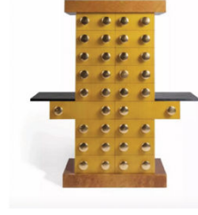
Mobile Giallo Design Gallery 1988 132 x 46 x 146