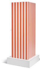
Armoire Superbox Poltronova 1966 80 x 80 x 200