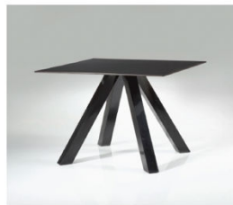
Table Crazy Horse Poltronova 1968 100 x 100 x 74