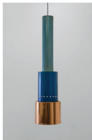
Suspension Prototype Poltronova 1965 75 x 20