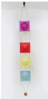
Suspension 12625 Arredoluce 1957 260 x 30 x 10