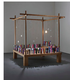
Architettura Romantica Clio Calvi 2004 200 x 200 x 250