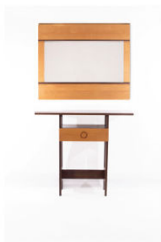
Miroir S.120 Console C.106 Poltronova 1964 120 x 34 x 106 120 x 2 x 96