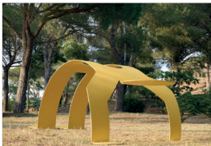
Sans titre (Yellow Arching Figure), 1985 Acier peint 189 x 528 x 307 cm

Œuvres : © Keith Haring Foundation, 2021