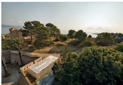
Pop Shop Tokyo, 1988 Technique mixte sur bois, plâtre et acier 236 x 1200 x 496 cm