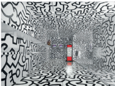
Pop Shop Tokyo, 1988 Intérieur Technique mixte sur bois, plâtre et acier 236 x 1200 x 496 cm