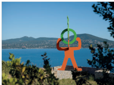
Sans titre (Headstand), 1987-1988 Acier peint 700 x 300 x 300 cm