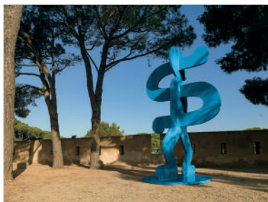
Sans titre (S-Man), 1987 Acier peint 370,8 x 218,4 x 226,1 cm Édition sur 3