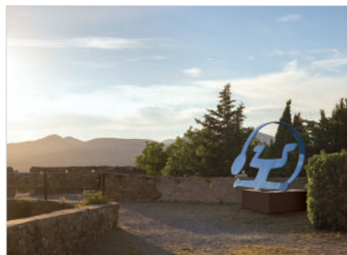
Sans titre (Blue Curling Figure), 1985 Acier peint 205 x 343 x 225 cm

Œuvres : © Keith Haring Foundation, 2021