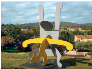
Sans titre (Head Through Belly), 1987 Acier peint 750 x 640 x 630 cm