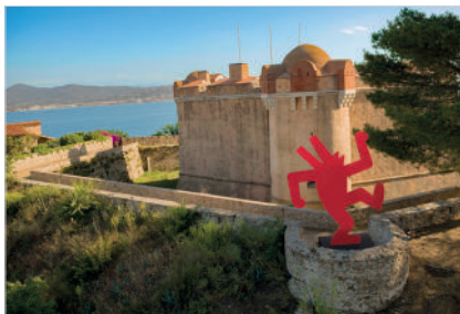
Sans titre, 1989 Acier peint 411,5 x 322,6 x 3,8 cm