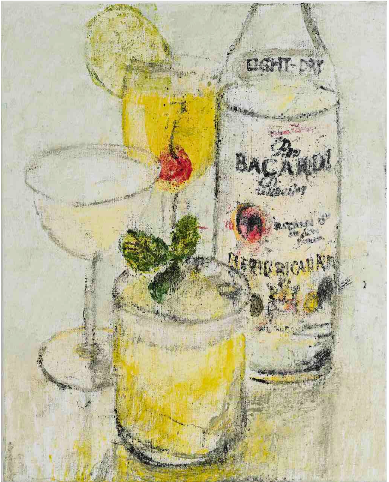
All ways, 2023 Huile sur toile 41 x 33 cm