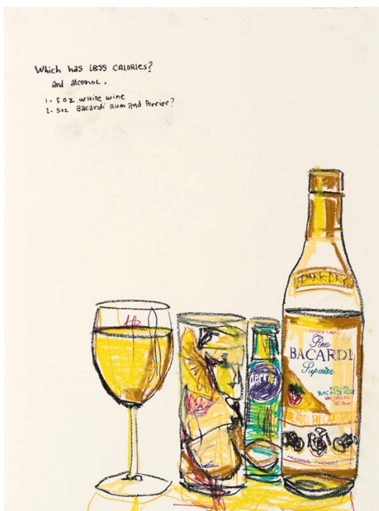
Sans titre, 2023 Crayon de cire sur papier 76 x 56 cm

Rejoignez-nous dans ce voyage envoûtant et découvrez comment l'art d'Enoc Pérez transforme l'ordinaire en extraordinaire, révélant les liens profonds entre l'identité, la mémoire et les images qui façonnent nos vies.